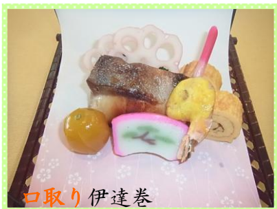
口取り伊達巻 鰯の照焼