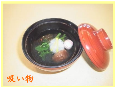
吸い物 菜の花と手鞠の吸い物