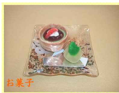
お菓子 栗きんとん 抹茶ババロア