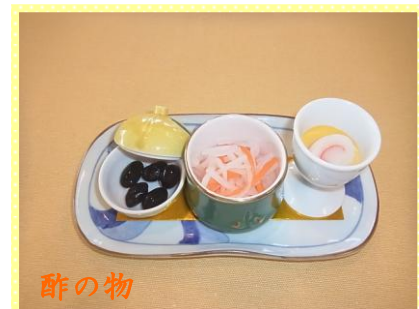
酢の物 紅白なます 砵巻き