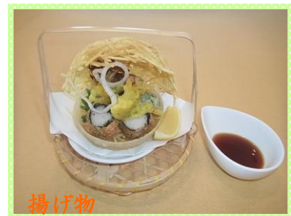
揚げ物 蟹しんじょう